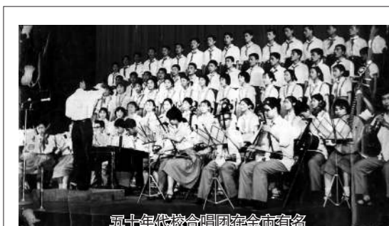
五十年代校合唱队在全国有名