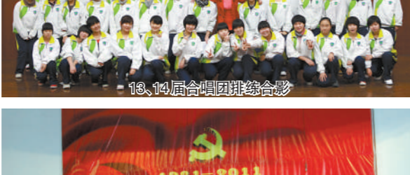
13、14届合唱团排练合影