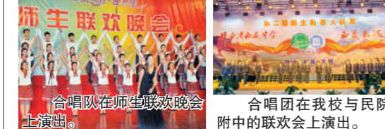
合唱队在师生联欢晚会上演出。