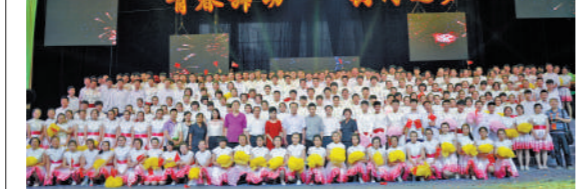
青春舞韵 共同追梦

据了解，接到任务时时间很紧张，从选曲、选人到组织排练、服装购置等，只有短短的6天可准备，还不能影响学生的上课和学习。