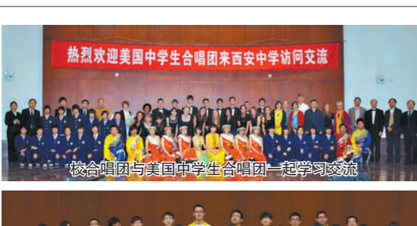
校合唱团与美国中学生合唱团一起学习交流