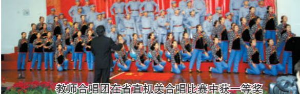
教师合唱团在省视机类合唱比赛中荣获一等奖