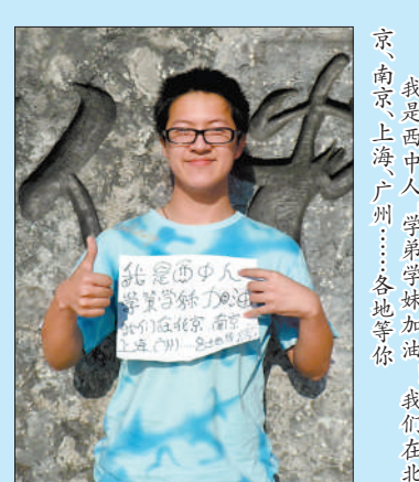
我是西中人，学弟学妹加油！我们在北京、南京、上海、广州……各地等你