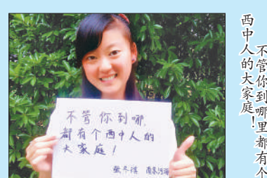
西中人的大家庭！不管你到哪儿都有个