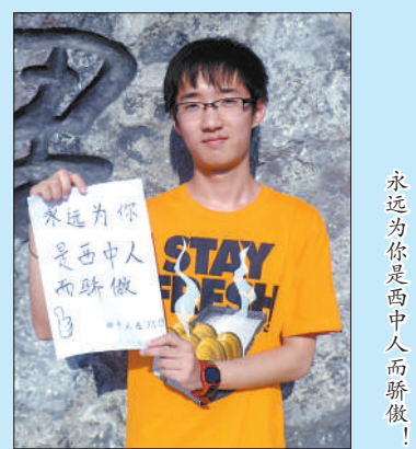
永远为你是西中人而骄傲！