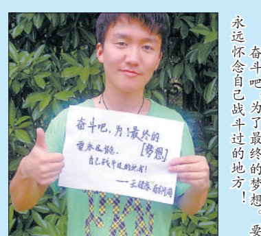
奋斗吧，为了最终的梦想。永远怀念自己战斗过的地方！要