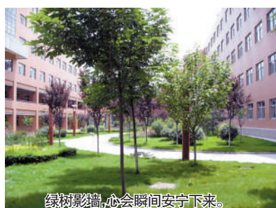
绿树影墙,心会瞬间安宁下来。