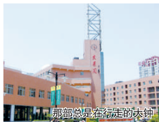
那部总是在行走的大钟