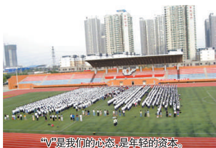
“V”是我们的姿态,是年轻的资本。