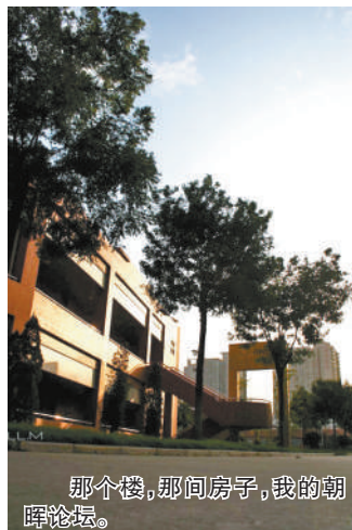
那个楼,那间房子,我的朝晖论坛。