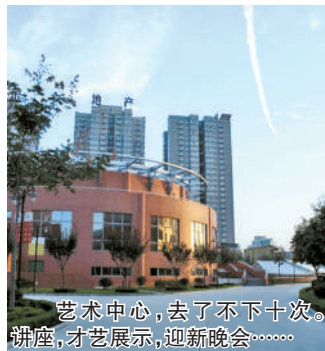
艺术中心,去了不下十次。讲座,才艺展示,迎新晚会……