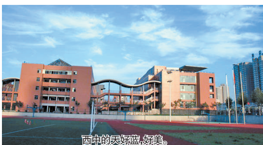
西中的天好蓝,好美。

目前,我国各大商业银行纷纷大量发行理财产品,市场利率急剧飙升,各银行间展开的蓝图大战已经是硝烟弥漫。更加甚者,6月29日至7月1日,短短三天时间银行的理财产品预期收益率都