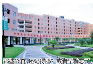
那些兴奋,还记得吗?或者早就忘了。

编者按:七月份,只能用一个字形容,那就是“热”。连续几天的高温直叫人叫苦连天。但是与七月的天气恰恰相反,中国股市一反常态,出现了瑟缩的冬天,我们微眼也斗胆说几句自己的看法。