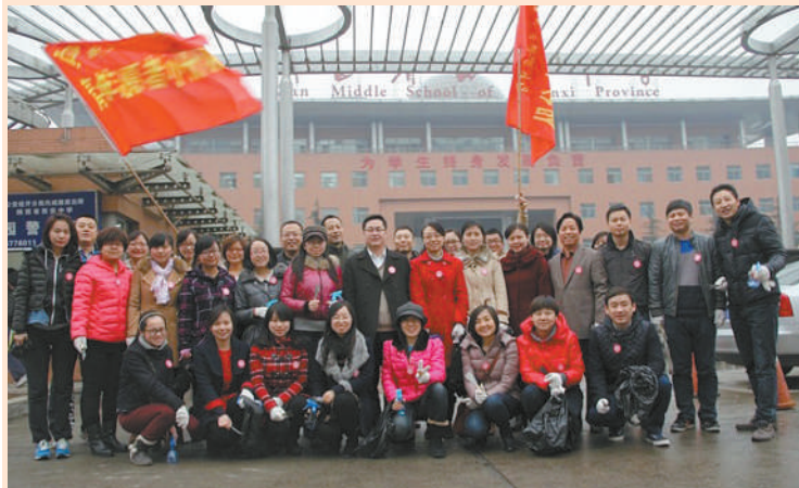
青年教师志愿者小分队走出校园,开展学雷锋活动